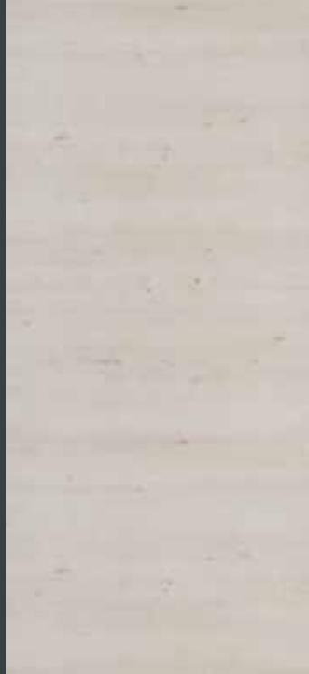
Érable Féroé Horizontal